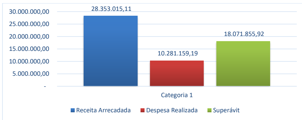
Gráfico nº01 – Demonstrativo da execução orçamentária.